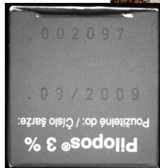
(Abbildung ähnlicher Produkte)