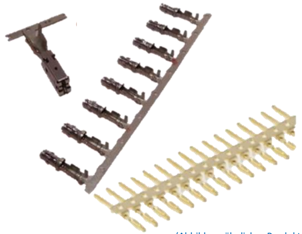
(Abbildung ähnlicher Produkte)